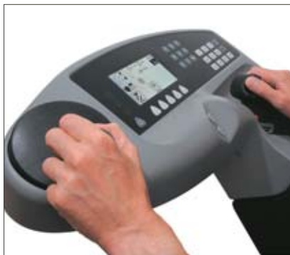
Pupitre de commande