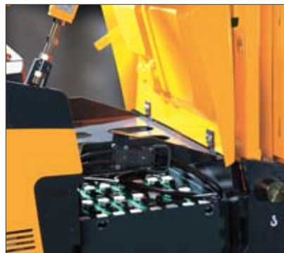
Capot de batterie relevable