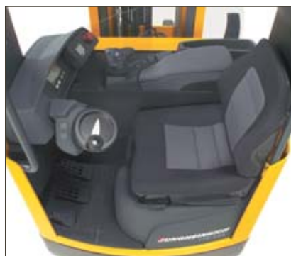
Poste de conduite ergonomique