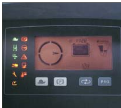
Ecran de contrôle