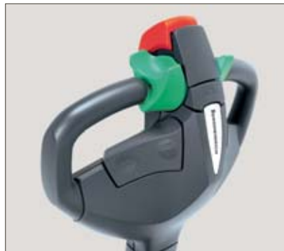
Tête de timon ergonomique