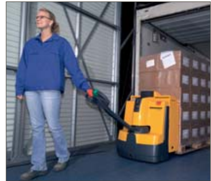
L'EJE utilisé pour le déchargement de camion