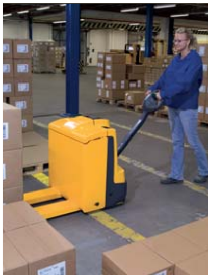
Utilisation en magasin