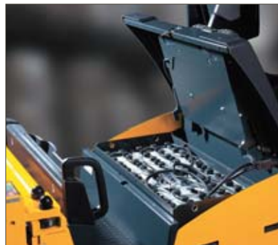
Capot de batterie relevable