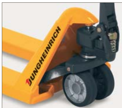
Graissage à vie des roulements étanches pour utilisation sans entretien

Les roulements étanches et les articulations permettent un fonctionnement remarquablement silencieux et ont une durée d'utilisation particulièrement longue et ne nécessitent plus aucun graissage.