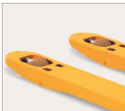
Pointes de fourche profilées pour une saisie plus simple des palettes

Fourche plus épaisse, en tôle pliée, support de timon renforcé, galets d'entrée carénés, un acier très résistant. Les meilleures garanties d'une stabilité et d'une longévité maximales. Les chiffres parlent d'eux-mêmes : 2200 kg de capacité nominale pour le modèle de base !