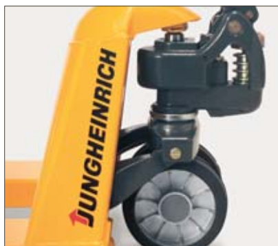
Hydraulique sans entretien

Le rendement du bloc hydraulique a été optimisé, d'où un moindre effort de pompage. Les roues avec bagues autolubrifiantes diminuent l'effort nécessaire au déplacement de la charge.