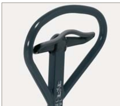
Poignée de commande accessible quelque soit la position de la main

La nouvelle poignée de commande au timon est simple et pratique, utilisable de la main droite comme de la gauche. La précision du vérin de descente permet de reposer en douceur la charge. La pompe à débit rapide – option – lève la palette du sol en 3 mouvements de timon et atteint la levée maxi en seulement 5 mouvements.